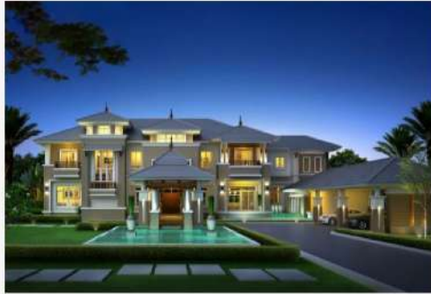
แบบบ้าน The Precious