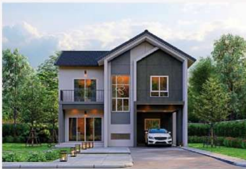
แบบบ้าน SMILE 3