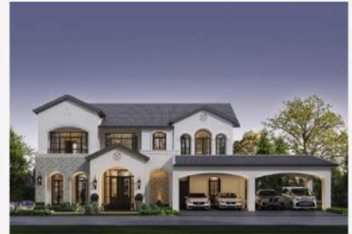
แบบบ้าน Valencia 588