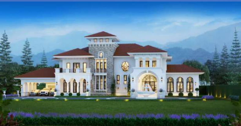
RCH 026 DI PALEMO