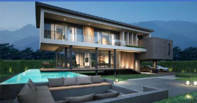
WISE E-29 LEMPEA