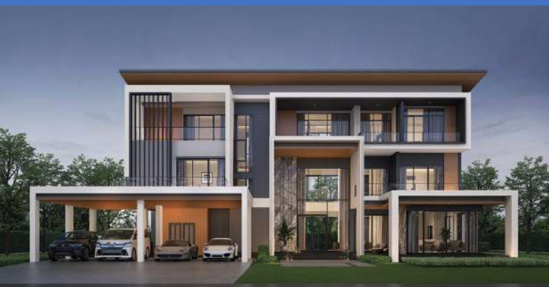
The Fame 1022