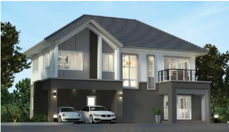
แบบบ้านปณิศา