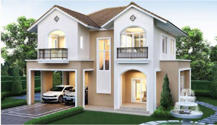
แบบบ้านลดาวัลย์