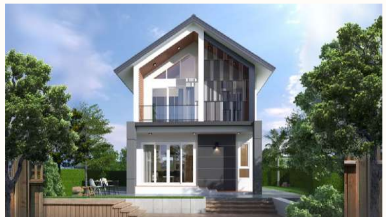
แบบบ้าน NE A-098