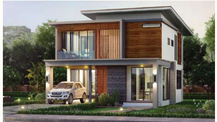
แบบบ้านทชพรรณ