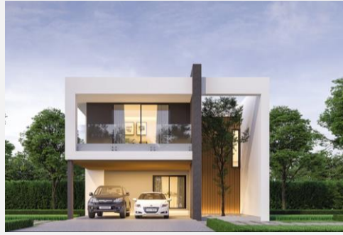
แบบบ้าน Cube 213