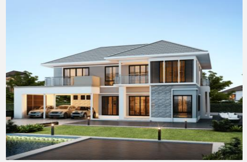
แบบบ้าน GEMINI GRAND