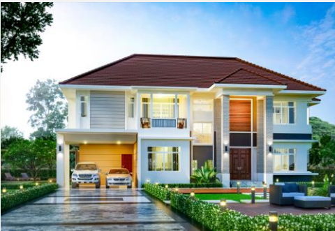
แบบบ้าน กชพร