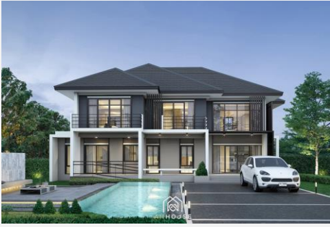
แบบบ้าน SS 303

แบบบ้านสไตล์โมเดิร์น การผสมผสานดีไซน์และความสะดวกสบายให้กับผู้อยู่อาศัย