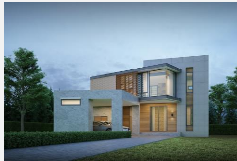
แบบบ้าน RH-MD. 2168