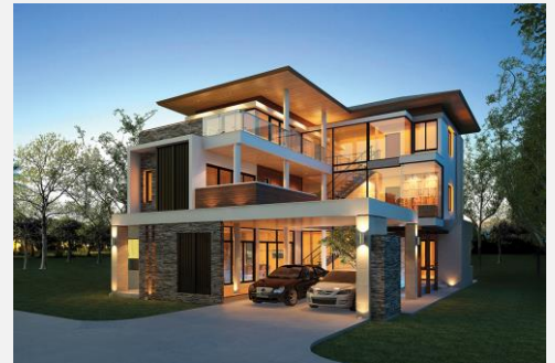
แบบบ้าน Urban 6